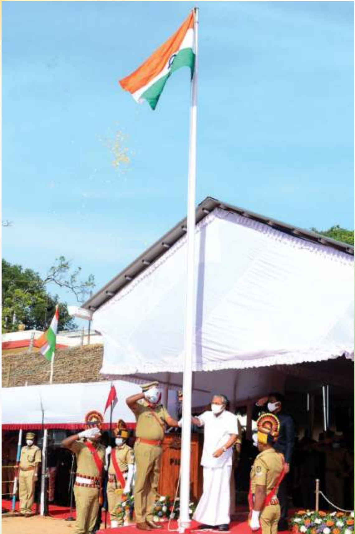
സ്വാതന്ത്ര്യദിനത്തിന്റെ സംസ്ഥാനതല ആഘോഷങ്ങളുടെ ഭാഗമായി തിരുവനന്തപുരം സെൻട്രൽ സ്റ്റേഡിയത്തിൽ മുഖ്യമന്ത്രി പതാക ഉയർത്തുന്നു