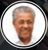
പിണറായി വിജയൻ മുഖ്യമന്ത്രി