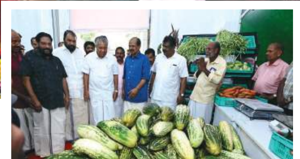
സപ്ലൈകോ-ഓണച്ചന്ത സംസ്ഥാനതല ഉദ്ഘാടനം

ഓണം, വിഷു, റംസാൻ, ക്രിസ്തുമസ് മുതലായ വിശേഷാവസരങ്ങളിൽ സപ്ലൈകോ പ്രത്യേക ഉത്സവച്ചന്തകൾ സംഘടിപ്പിക്കാറുണ്ട്. ഈ വർഷം വിലയേറിയ ഓണം ഫെയറുകളാണ് സിവിൽ സപ്ലൈസ് കോർപ്പറേഷൻ വഴി ഒരുക്കിയത്. എയർകണ്ടീഷൻ സൗകര്യത്തോടെയുള്ള ജർമ്മൻ ഹാങ്ങറുകളിലാണ് ഫെയറുകൾ നടന്നത്. ആധുനിക സൂപ്പർ മാർക്കറ്റുകളോട് കിടപിടിക്കുന്ന രീതിയിലുള്ള വിൽപന രീതികളും ഇന്റീരിയർ സൗകര്യങ്ങളും ഉള്ള ഇവയിൽ മിൽമ, കേരഫെഡ്, കുടുംബശ്രീ ഉൾപ്പെടെയുള്ള സ്ഥാപനങ്ങളുടെ സ്റ്റാളുകളും പ്രാദേശികകർഷകരിൽ നിന്നും സംഭരിക്കുന്ന പച്ചക്കറികളുടെ വിപണനവും ഉണ്ടായി. പൊതുമേഖല സ്വകാര്യസ്ഥാപനങ്ങളുമായി സഹകരിച്ച് അവിടുത്തെ ജീവനക്കാർക്ക് 500, 1000 രൂപ വിലവരുന്ന കൂപ്പൺകൾ സൗജന്യനിരക്കിൽ വിതരണം ചെയ്തു. ഇവ പ്രയോജനപ്പെടുത്തി ജീവനക്കാർക്ക് സപ്ലൈകോയുടെ ഇഷ്ടമുള്ള വിൽപനശാലകളിൽ നിന്നും ഇഷ്ടമുള്ള സാധനങ്ങൾ തിരഞ്ഞെടുക്കാൻ അവസരം നൽകി. ഓണത്തോടനുബന്ധിച്ച് അഞ്ച് ഇനം പുതിയ ശബരി ഉൽപ്പന്നങ്ങൾ കൂടി സപ്ലൈകോ വിപണിയിലിറക്കി. മട്ട അരി, ആന്ദ്ര ജയ അരി, ആട്ട, പൂട്ടപൊടി,