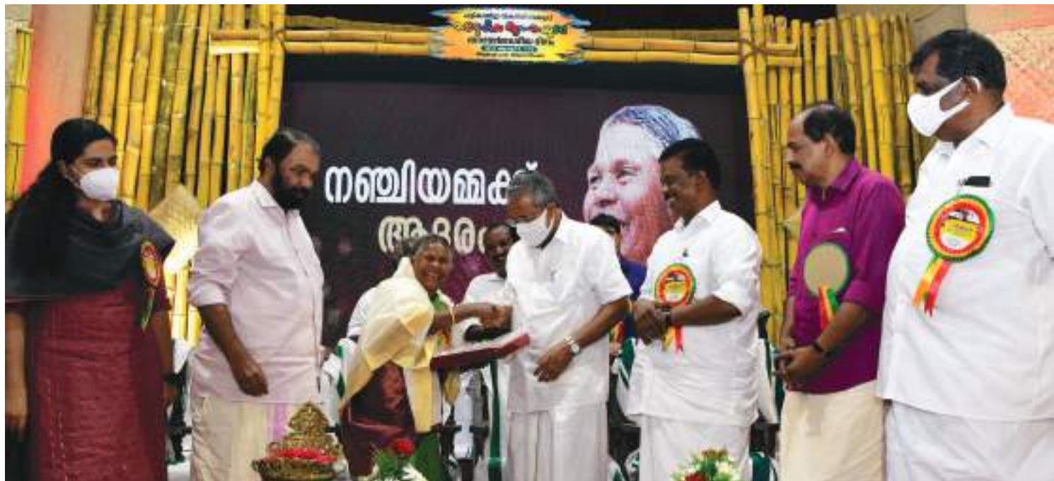
തദ്ദേശീയ ജനതയുടെ ദിനാചരണത്തോടനുബന്ധിച്ച് നഞ്ചിയമ്മയെ സംസ്ഥാന സർക്കാർ ആദരിച്ചപ്പോൾ