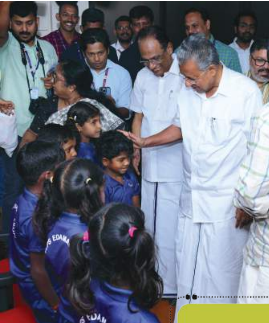
ഇടമലക്കുടിയിലെ കുട്ടികൾ നിയമസഭ സന്ദർശിച്ചപ്പോൾ മുഖ്യമന്ത്രിക്കൊപ്പം

മനോൻ സിങ്ക്ചറൽ ഫിറ്റർ എന്നീ കോഴ്സുകളിലും പരിശീലനം നൽകുന്നതിനുള്ള നടപടി ആരംഭിച്ചുകഴിഞ്ഞു.