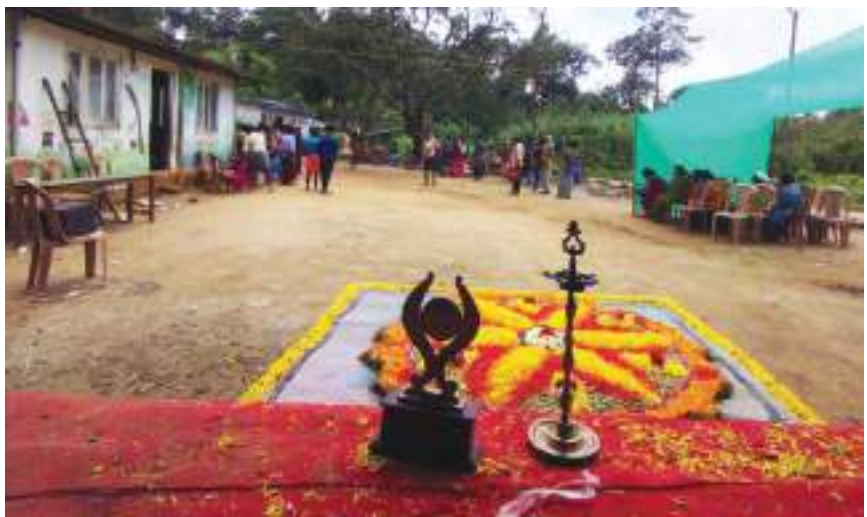
📷 ആനൂണി മുനിയം

അറുതിയുണ്ടാകും. നിലവിൽ ജീപ്പുകൾ ഇഡലിപ്പാറ വരെ എത്തിയതോടെ പെട്ടിമുടിയിലേക്കും മൂന്നാറിലേക്കും കാടിന്റെ മക്കൾക്ക് എത്തിച്ചേരാനു എളുപ്പമായി. പെട്ടിമുടി മുതൽ ഇഡലിപ്പാറ വരെ 7.7 കിലോമീറ്റർ ദൂരവും തുടർന്ന് സൊസൈറ്റിക്കുടിവരെയുള്ള നാലേമു ക്കാൽ കിലോമീറ്റർ റോഡും പൂർത്തിയാകുന്നതോടെ കാടിനുള്ളിലെ ഈ ഗോത്രഗ്രാമത്തിലേക്ക് വേഗത്തിൽ എത്തിച്ചേരാൻ കഴിയും.