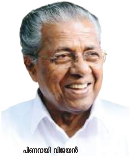
പിണറായി വിജയൻ മുഖ്യമന്ത്രി

സംസ്ഥാനത്തെ ജനസംഖ്യയുടെ 1.45 ശതമാനമാണ് തദ്ദേശീയ ജനവിഭാഗങ്ങൾ. അവരുടെകൂടി ഉന്നമനം ലക്ഷ്യംവച്ചുള്ള സമഗ്രപദ്ധതികളാണ് സർക്കാർ നടത്തിവരുന്നത്. അടിസ്ഥാന സൗകര്യങ്ങളൊരുക്കുന്നതിനൊപ്പം വൈജ്ഞാനിക മുന്നേറ്റത്തിനും തദ്ദേശീയ ജനതയെ പ്രാപ്തരാക്കുകയാണ് സംസ്ഥാന സർക്കാരിന്റെ ലക്ഷ്യം