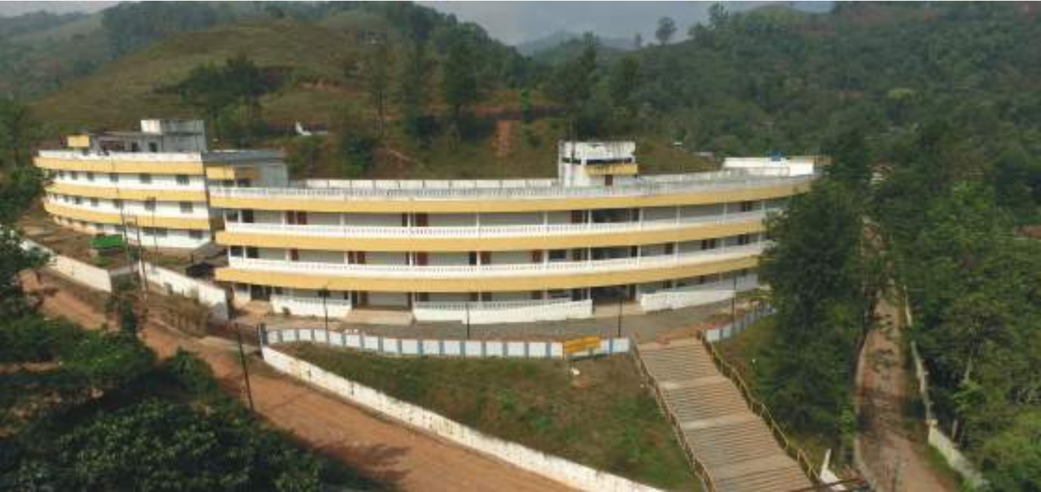
എം.ആർ.എസ്. പൂക്കോട് വയനാട്

ഫലങ്ങൾ കൈവരിക്കുന്ന മികവിന്റെ കേന്ദ്രങ്ങളാണ് എം.ആർ.എസ്. 5500 ഓളം വിദ്യാർത്ഥികൾ ഈ സ്ഥാപനങ്ങളിൽ പഠിക്കുന്നുണ്ട്.