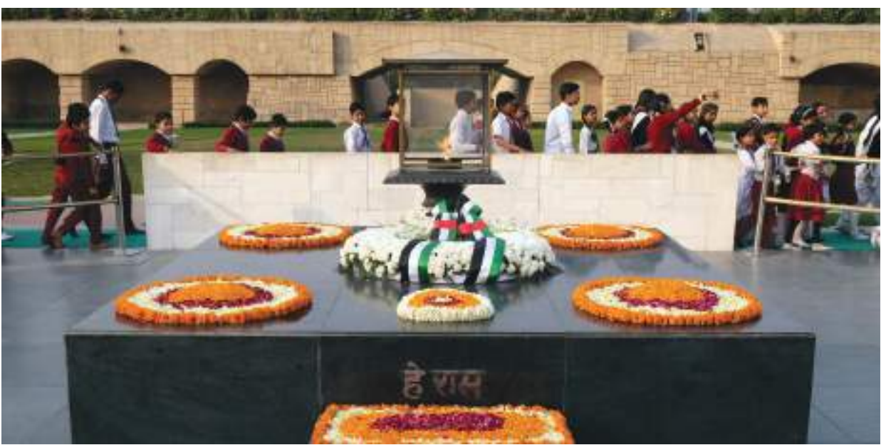
രാജ്ഘട്ട്: ശാസ്തിജിയുടെ രക്തസാക്ഷിത്വവുമായി ബന്ധപ്പെട്ട പാഠഭാഗമാണ് സംസ്ഥാനം പുനഃപ്രസിദ്ധീകരിച്ചതിൽ ഒന്ന്

കൊല്ലം 2002 ലെ ഗുജറാത്ത് കലാപം, ശിതയുദ്ധങ്ങൾ, ഇന്ത്യയുടെ ചേരിചേരാനയം അമേരിക്കൻ സർവാധിപത്യ ശ്രമങ്ങൾ തുടങ്ങിയവയും ലളിതമായ രീതിയിൽ ഉൾപ്പെടുത്തിയിരിക്കുന്നു.