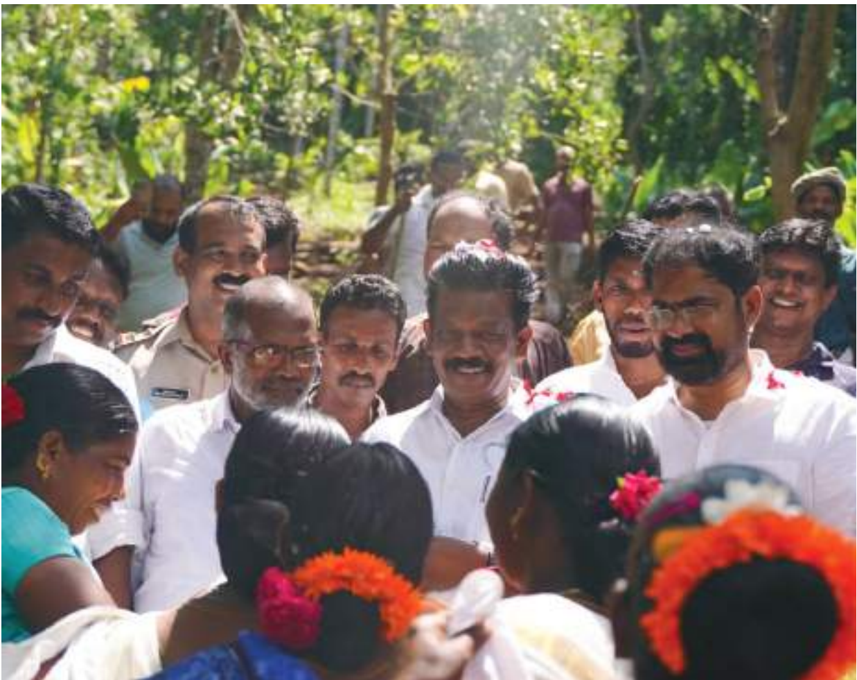
തൃശൂരിലെ പട്ടികവർഗ ഗ്രാമമായ വെട്ടിവിട്ടകാട് വൈദ്യുതീകരണം ഉദ്ഘാടനത്തിന് മന്ത്രി കെ. രാധാകൃഷ്ണൻ എത്തിയപ്പോൾ

നമ്മുടെ രാജ്യം സ്വാതന്ത്ര്യം നേടിയിട്ട് മൂക്കാൽ നൂറ്റാണ്ട് പിന്നിട്ടിട്ടും ഇന്ത്യൻ ജനസംഖ്യയുടെ 30 ശതമാനത്തിലധികം വരുന്ന പട്ടികജാതി പട്ടികവർഗ വിഭാഗങ്ങൾ ഇന്നും സമൂഹത്തിന്റെ പിൻനിരയിലാണ്. എന്നാൽ രാജ്യത്തെ പൊതുസ്ഥിതിയിൽ നിന്നും ഏറെ മുന്നിലാണ് കേരളം. ഇനിയും പരിഹരിക്കേണ്ട കുറെ വിഷയങ്ങൾ കൂടിയുണ്ട്. അതിനുള്ള കഠിന പരിശ്രമത്തിലാണ് ഈ സർക്കാർ ■